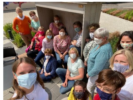
Mittagspause beim Workshop in Oldenburg